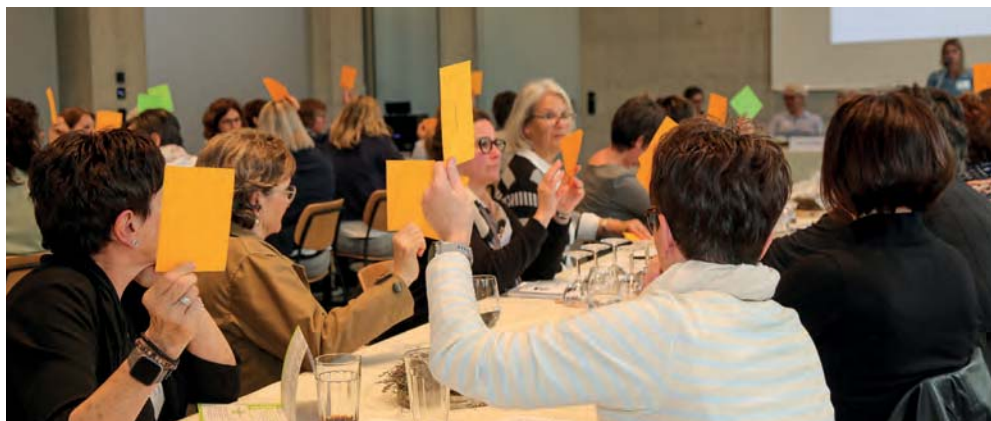
An der GV wird abgestimmt und entschieden, Mitgliederbeiträge einzuführen (Bild links).